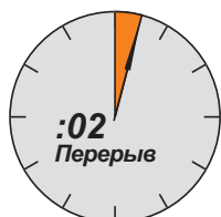
Новые Cleco серии D

Запатентованная конструкция Cleco позволяет тратить на обслуживание всего 2 минуты!